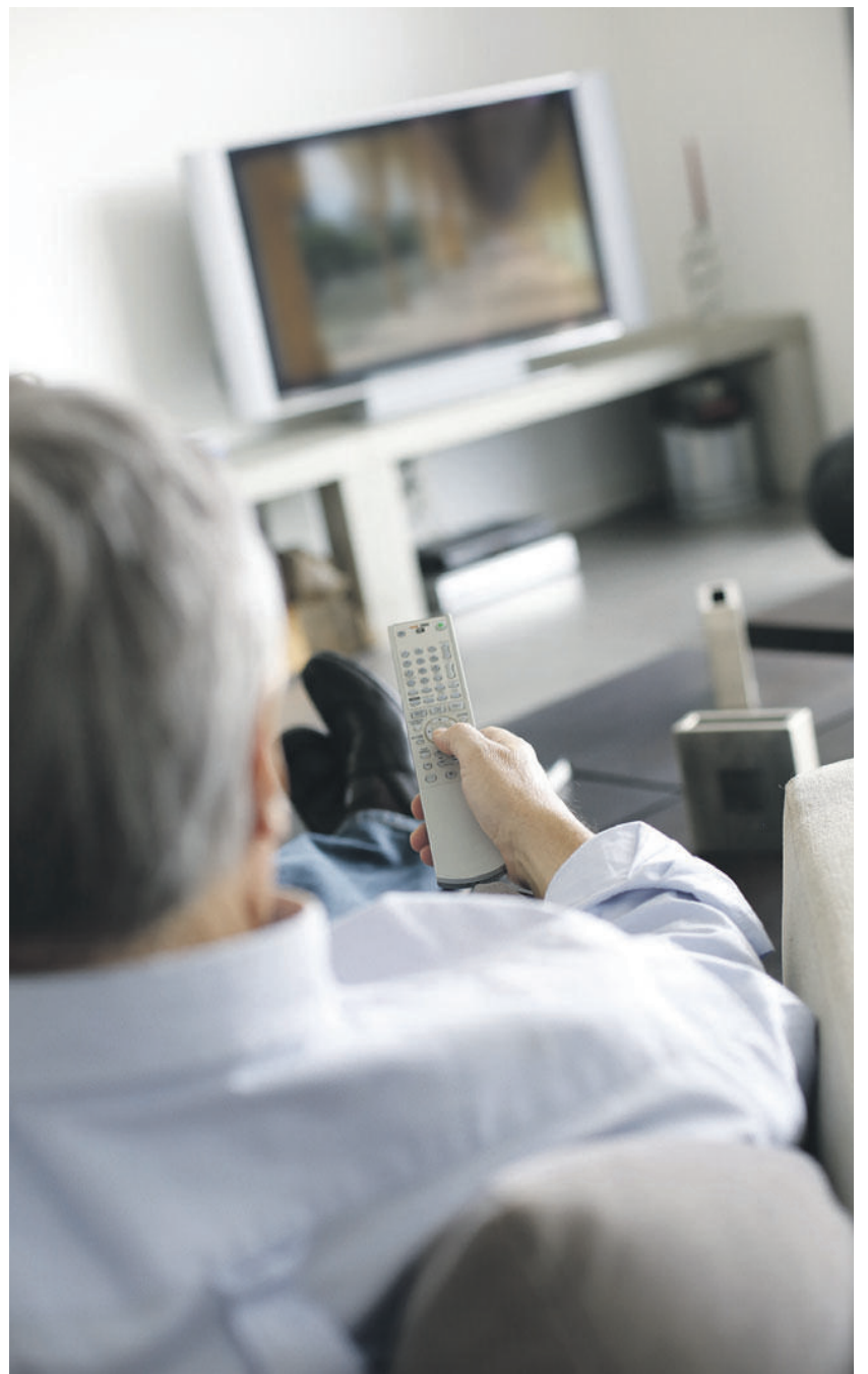
Vor allem ältere Einwohner wünschten sich gemäss einer Umfrage die Weiterführung des Gemeindekanals in Eschen-Nendeln. (Foto: Shutterstock)

Um diesem Wunsch nachzukommen, prüfte der Gemeinderat mehrere Varianten. Der Verbleib auf dem bisherigen SD-Signal hätte dabei zwar keine Investitionskosten mit sich gebracht, bringe aber auch diverse Nachteile mit sich. Neben der schlechten Qualität bestehe etwa das Risiko eines plötzlichen Handlungsbedarfs, weil die Technik veraltet sei. Zudem hätten sich die Einwohner das Aufrüsten auf HD gewünscht. Aus diesem Grund hat sich der Gemeinderat für die Lösung der Firma Byteraider entschieden, welche die Präsentation und Kombination von Bilddateien, Videos und Live-Webseiten ermögliche. Die Gemeinde rechnet laut dem Protokoll mit Investitionskosten von 8000 und einem jährlichen Unterhalt von 1500 Franken, was nur rund einem Sech-