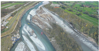
Der Rhein bei Vaduz vor (oben) und nach einer Renaturierung.

vemberhälfte präsentiert. Götz erhofft sich dadurch eine Versäglichung der politischen Debatte. Im Entwicklungskonzept Alpenrhein, das von Liechtenstein, Österreich und der Schweiz ausgearbeitet wurde, wären in Liechtenstein vier Aufweitungen vorgesehen: Bei Balzers, Vaduz, Eschen und Ruggell. (df)